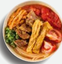
招牌春卷牛腩米線